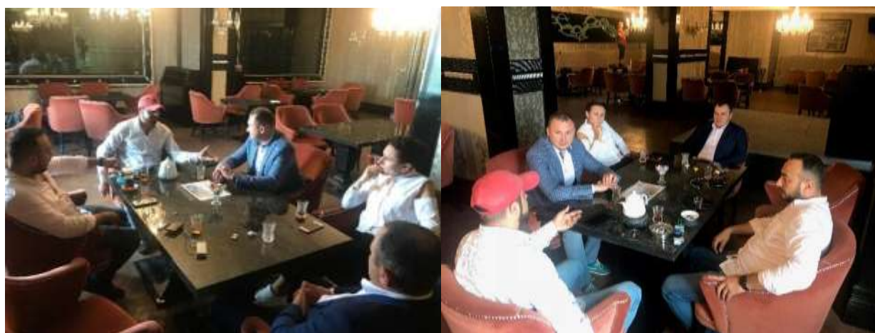
Переговоры с представителями компании «Росгофра».

Стороны пришли к выводу, что для смоленского производителя перспективным направлением сотрудничества является поставка либо эксклюзивной продукции, либо отгрузка по конкурентной цене. Была достигнута договоренность о сборе технических заданий для разработки и производства на базе ООО «Росгофра» продукции для азербайджанских предприятий, осуществляющих сбор плодоовощной продукции у фермерских хозяйств.