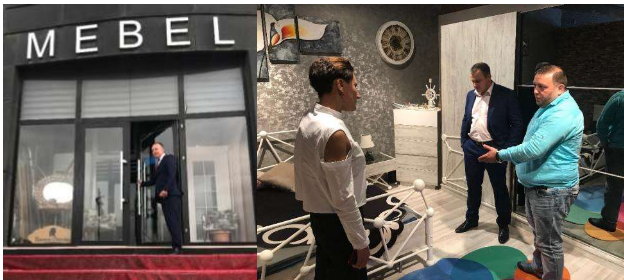
Встреча с мебельными компаниями Азербайджана.

Представители ООО «Росгофра» провели переговоры с компаниями, занимающимися выращиванием овощей на предмет поставки упаковки для их нужд. По результатам переговоров было установлено, что все крупные потребители картонной упаковки производят ее для своих нужд самостоятельно. Однако, для поставки эксклюзивной упаковки стороны договорились о продолжении переговоров и дальнейшем сотрудничестве.