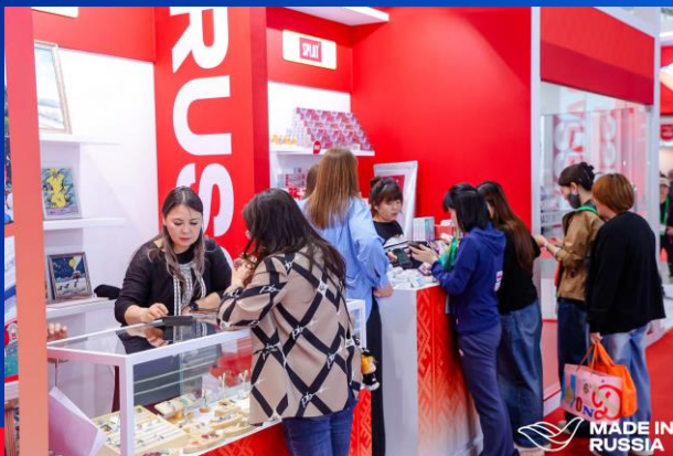
ЯРМАРКА РОССИЙСКИХ ТОВАРОВ